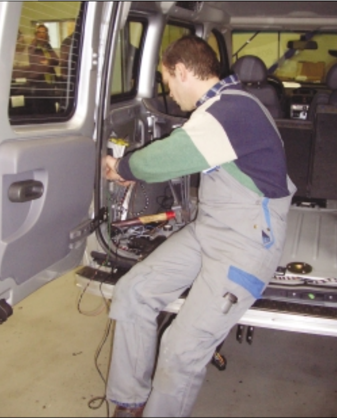
Ob Radio, Standheizung, Winterreifen oder Chip-Tuning – die kleine Werkstatt verbaut und installiert auf Kundenwunsch viel Zubehör.

setzt ist. Diese leiten die Kunden mit ihren Wünschen an die entsprechenden Verkäufer weiter. Damit alle Mitarbeiter immer auf dem Laufenden sind, investiert Jütten & Koolen 20 bis 30 Tage in Schulungen. Diese laufen sowohl im eigenen Unternehmen als auch extern ab. Um Schulungsinhalte intern weiterzugeben, findet einmal im Monat abteilungsübergreifend eine Mitarbeiterversammlung statt.